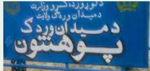
شریعت: د میدان وردگ ولایت په پوهنتون کې د ۱۹۰۲ میلیونه

افغانیو په ارزښت پېلابېلې پروژې بشپړې او کټې اخیستلو ته وسپارل شوي. د دغه ولایت چارواکو ویلي، چې د ۴.۵ میلیونه افغانیو ترمیماتي، د ۵ میلیونه افغانیو د سولري برېښنا، د ۷ میلیونه افغانیو د کمپیوټرلب او سولري برېښنا، د ۲ میلیونه افغانیو د کتابتون ... ۷مخ