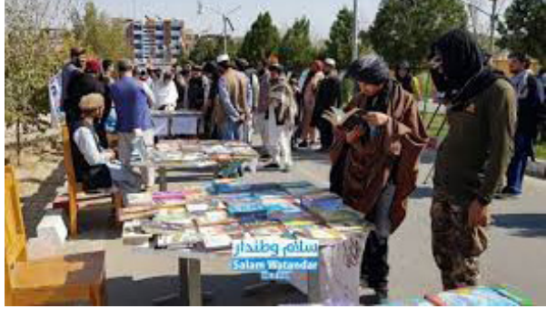
يو ورځنی نندارتون جوړ شو.

د فارياب د عامه کتابتون له لوري د اطلاعاتو او کلتور رياست په همغږۍ د کتابونو