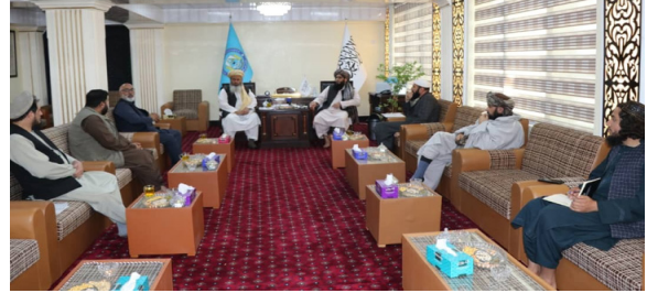
شریعت: والی کابل می‌گوید که مؤسسات امدادرسان باید در بخش‌های بنیادی، پروژه‌های اساسی و مدیریت آب... ص