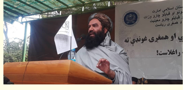
پي او همغري غونډې ته راغلاست!

شریعت: سرپرست وزارت امور سرحدات، اقوام و قبایل در دیدار با نماینده های شماری از موسسات گفت: در سی و چهار ولایت کشور نشست هایی را با اشتراک علمای دین، سران قبایل و متنفذین برگزار کرده، مشکلات و ... ص ۵