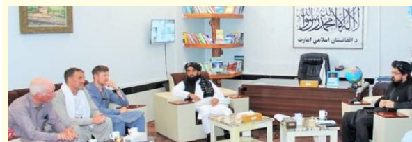
کندهار ولایت ته په یوه ورځ کې له بېلابېلو هېوادونو څخه ۱۵ سېلانیان راغلي دي. د کندهار د اطلاعاتو او کلتور ۷ مخ