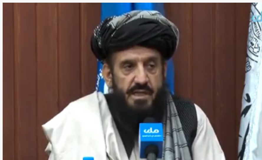
د کار او ټولنیزو چارو وزارت ترمنځ د خوانانو لپاره د کار او د پنځه کورنیو موسسو موندني او په هېواد کې له

یو کلن هوکړه لیک لاسلیک شو. د دغه وزارت له نړیوالو مرستندویو بنسټونو وغوښتل چې له ارمنو افغانانو سره خپلې مرستې زیاتې کړي. د یادو بنسټونو مسوولینو په دغه بهیر کې پرو نټیا ټینکار وکړ او وې ویل چې په بېلابېلو ولایتونو کې به د نړیوالو بنسټونو په همکارۍ خپل خدمات پیل کړي. د کار او ټولنیزو چارو وزارت وایي، چې ارمنو کسانو ته د خدمتونو د وړاندې کولو په برخه کې د کورنیو او بهرنیو بنسټونو لپاره زیاتې آسانتیاوې برابرېږي.