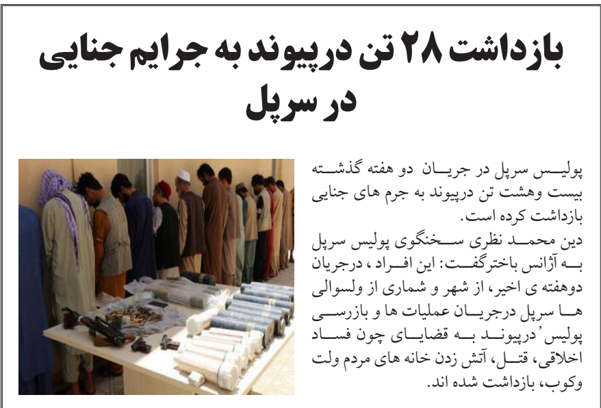
پولیس سرپل در جریان دو هفته گذشته بیست وهشت تن درپیوند به جرم های جنایی بازداشت کرده است.