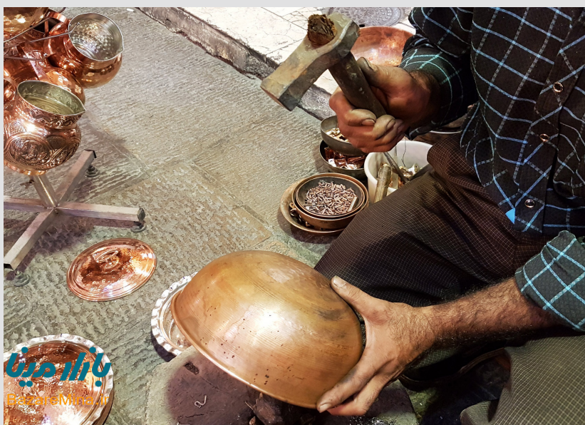
خو زړې ښځې به ورته ویل: نه کیږي چې په ٦ ریال یې واخلي؟ اهنگر به ورته وویل: چې نه مورې په دې قیمت موږ ته کته نه کوي. زړې ښځې